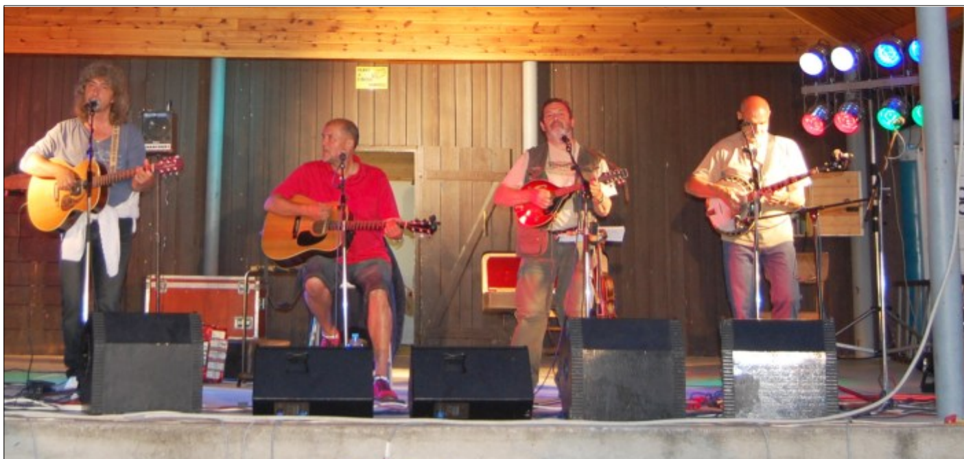
Rozcestník 2009 - skupina Rangers - Plavci.

Číslo účtu u Komerční banky 43-2 782 380 237 / 0100.