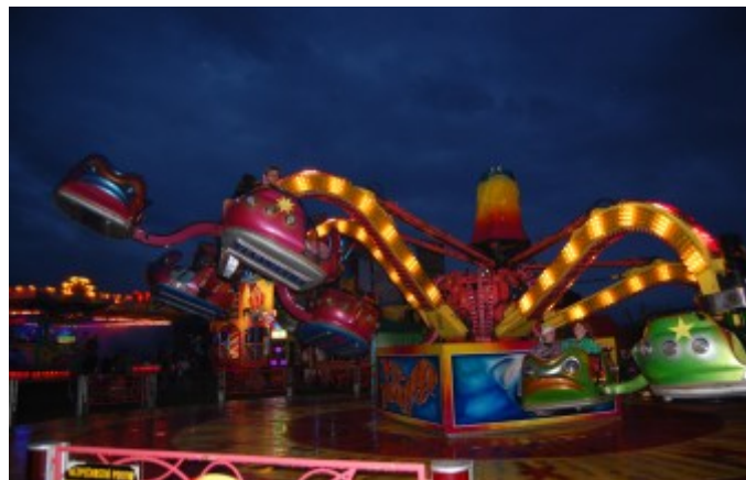
Letošní Brništskou pouť navštívilo 2809 dospělých a 888 dětí.