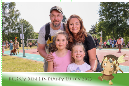
DĚTSKÝ DEN S INDIÁNY LUHOV 2023