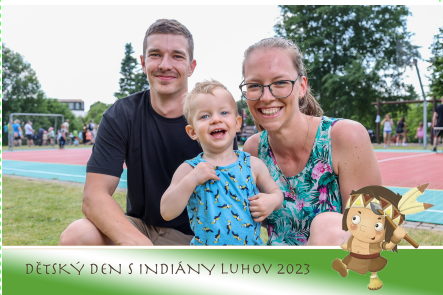
DĚTSKÝ DEN S INDIÁNY LUHOV 2023