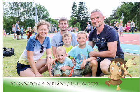
DĚTSKÝ DEN S INDIÁNY LUHOV 2023