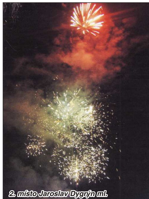
2. místo Jaroslav Dygrýn ml.