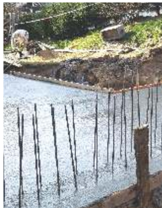
Rekonstrukce mateřské školy začala.